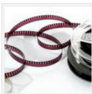
Fundación Mapfre apresenta 60ª edição do festival de cinema San Sebastián