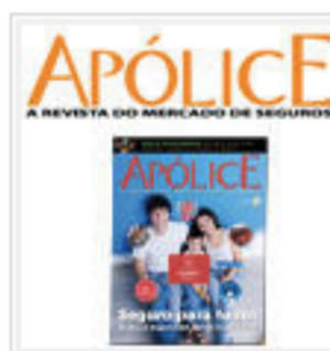
Central Única das Favelas cria seguro social